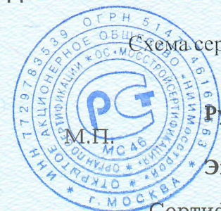
Схема сертификации 4с