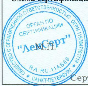
Схема сертификации За.