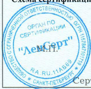
Схема сертификации За.